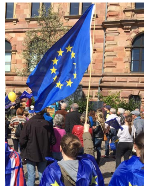
DIE BEWEGUNG „PULSE OF EUROPE“ DEMONSTRIERT IN VIELEN STÄDTEN - WIE HIER IN WIESBADEN - FÜR EINE PROEUROPÄISCHE POLITIK

pagnen gegen Europa wehrten.“ Schäfer-Gümbel forderte: „Sagen Sie endlich klar und deutlich, dass es den Deutschen nur gut gehen kann, wenn es auch den Spaniern, Italienern, Portugiesen und Griechen gut geht. Keine europäische Volkswirtschaft profitiert so sehr vom gemeinsamen Wirtschaftsraum wie unsere.“