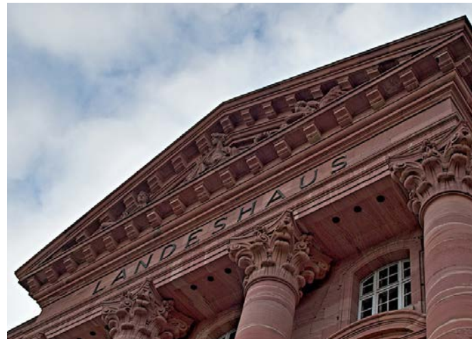
DICKE LUFT HERRSCHT IM HESSISCHEN WIRTSCHAFTSMINISTERIUM: MINISTER AL-WAZIR HAT NACH MEDIENBERICHTEN EINEN ERFAHRENE ABTEILUNGSLEITER KALTGESTELLT.